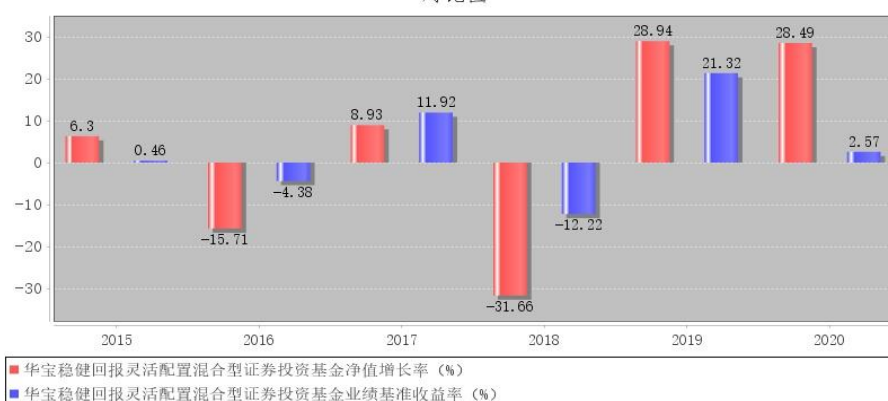
华宝稳健回报灵活配置混合型证券投资基金每年净值增长率与同期业绩比较基准收益率的对比图